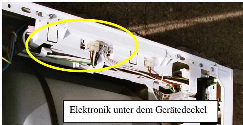
Elektronik unter dem Gerätedeckel